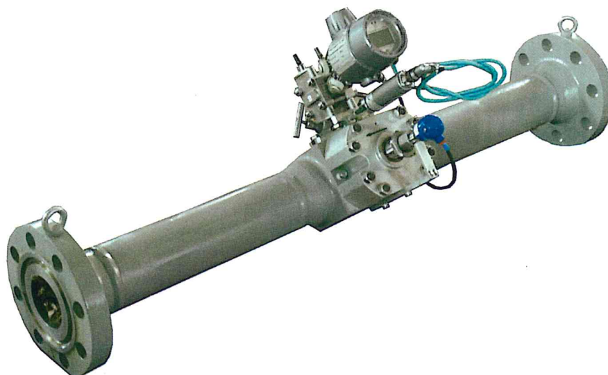
а) Расходомер газа «ГиперФлоу» КРАУ2.833.006

Общий вид расходомеров газа «ГиперФлоу» приведен на рисунке 1.