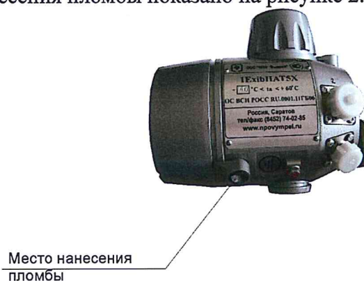
Рисунок 2. Место пломбирования датчиков комплексных с вычислителем расхода «ГиперФлоу-3Пм» из состава расходомера газа

Конструкция датчиков комплексных с вычислителем расхода «ГиперФлоу-3Пм» предусматривает защиту доступа к программирующему разъему микропроцессора путем пломбирования. Место нанесения пломбы показано на рисунке 2.